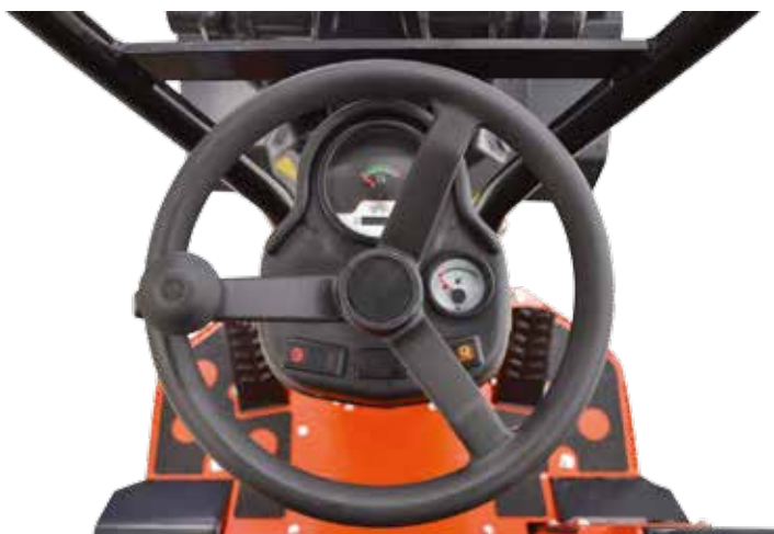
Tableau de bord

Le tableau de bord vous permet de voir en un seul coup d'oeil la température du liquide de refroidissement et le niveau de carburant. Des témoins lumineux vous avertissent de problèmes sur la pression d'huile, la charge ou la température.