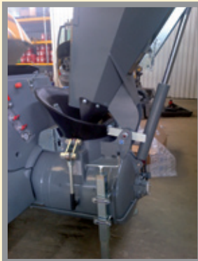
La cuve est équipée de béquilles stabilisatrices et d'un entonnoir en matière composite peu salissante.