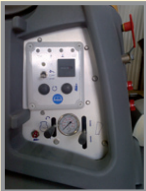
Le tableau de commande est simple, clair et complet