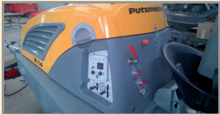
Poste de commande central permettant de piloter et de visualiser l'ensemble de la M720DHB-SKIP.